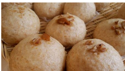
看板商品のおやき

決算の事務処理についても商工会から教えていただいたのですが、納税額の計算だけでなく、経営分析についても一緒に考えていただきました。一年の経営を振り返って、計画どおりできた部分とできなかった部分とが明確になったので、一日も早く経営が軌道に乗るようにチャレンジしていきたいですね。